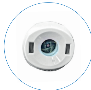
Sistema de vedação em pétalas